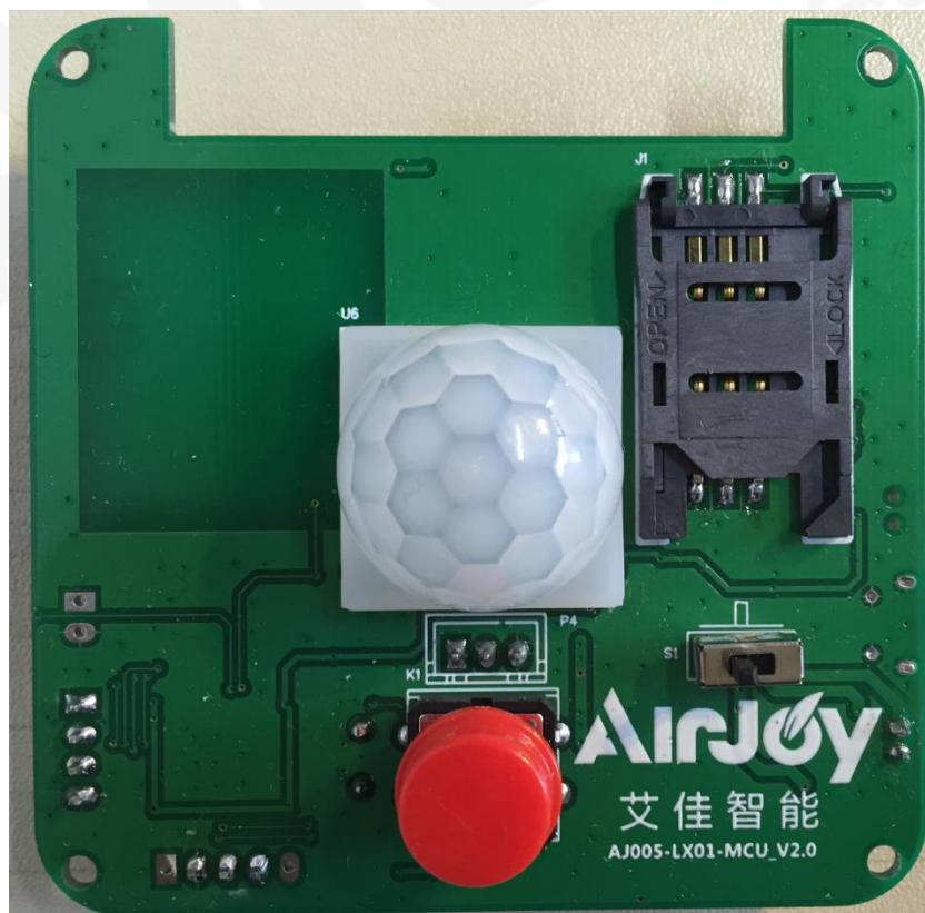
图 2 硬件 PCB 图